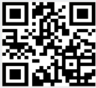
QR Code แบบประเมินความพึงพอใจด้านทดสอบมาตรฐาน